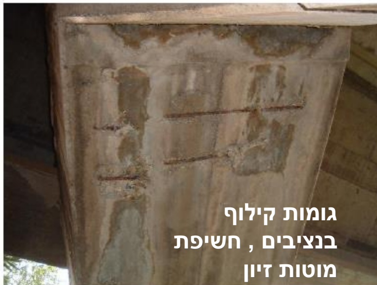
גומות קילוף בנציבים, חשיפת מוטות זיון