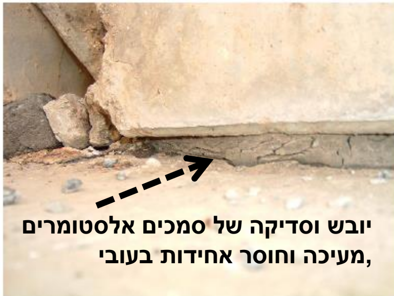
יובש וסדיקה של סמכים אלסטומרים, מעיקה וחוסר אחידות בעובי