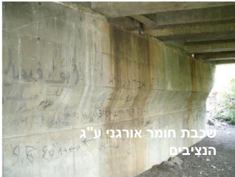
שכבת חומר אורגני ע"ג הנציבים