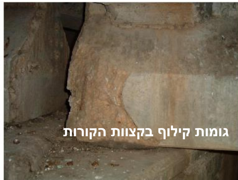
גומות קילוף בקצוות הקורות