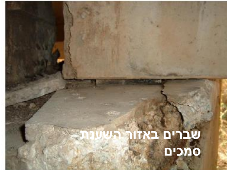
שברים באזור השענת סמכים